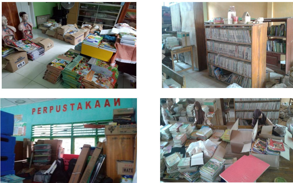
Gambar 1. Beberapa contoh kondisi perpustakaan sekolah yang kurang representatif

Pengelolaan perpustakaan seringkali diabaikan, mulai dari tidak diprioritaskannya pemilihan ruangan gedung perpustakaan (biasanya mendahulukan kepentingan ruang kepala sekolah/ruang guru), abai atas penataan ruangan, penataan rak dan buku koleksi, tata pencahayaan dan dekorasi yang membuat siswa tidak tertarik dan tidak merasa nyaman di perpustakaan, sampai pada minimnya program perpustakaan untuk menarik minat siswa datang dan berlama-lama membaca di perpustakaan. Beberapa kali observasi didapatkan kondisi yang memprihatinkan dimana perpustakaan sekolah diletakkan pojok paling belakang, dengan ruangan sempit bahkan ada yang digabung dengan gudang atau dapur, tata ruang apa adanya bahkan ada yang mirip dengan gudang, penataan buku yang ditumpuk begitu saja (bahkan ada yang masih tertutup rapat dalam kardus), pencahayaan yang tidak terang dan dekorasi yang apa adanya dan cenderung tidak menarik. Sekolah juga tidak memiliki program untuk memanfaatkan perpustakaan secara rutin, inisiatif guru untuk mendorong siswa datang dan membaca di perpustakaan dengan mengintegrasikan pada kegiatan pembelajaran juga minim, apalagi program yang memacu dan menantang siswa untuk membaca juga tidak ada. Hal yang lebih memprihatinkan adalah ketika perpustakaan dijadikan ruangan “menghukum” siswa ketika terlambat, tidak mengerjakan PR atau kenakalan siswa lainnya. Berikut beberapa contoh kondisi tersebut seperti yang ada pada beberapa sekolah yang pernah diobservasi.